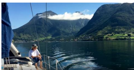
Taskekrabber – lækker !

Efter mødet med Zoe i Stavanger kan man som tilskuer glæde sig over næsten eventyrlige vand- og landskaber. Og det giver rejseberetningen en særlig dimension at de 2 sejlene ser ud til at have det godt sammen og spreder glæde om sig og oplever nordmændenes venlighed mange gange bl.a. gennem at de forærer fisk og taske-krabber til turisterne – og spiser og hygger – og fester i fællesskab.